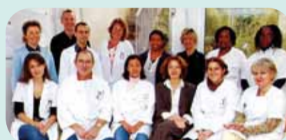
Équipe département Biothérapie du Pr CAVAZZANA-CALVO Hôpital Necker.