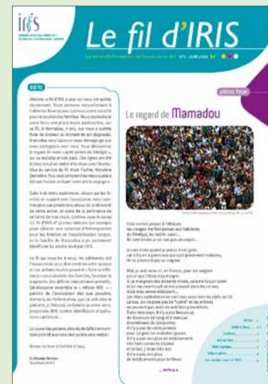
Le fil d'IRIS trimestriel