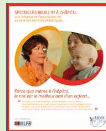
Livret Spectacles Bouillry à l'Hôpital