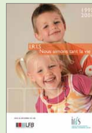
Un DVD IRIS Nous aimons tant la vie!