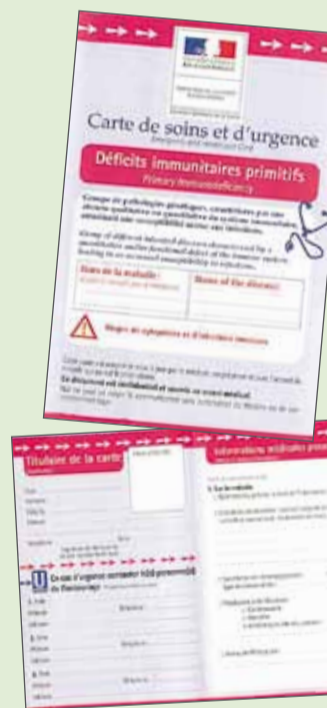
Carte de soins et d'urgence réalisée avec le CEREDIH et le ministère de la Santé.